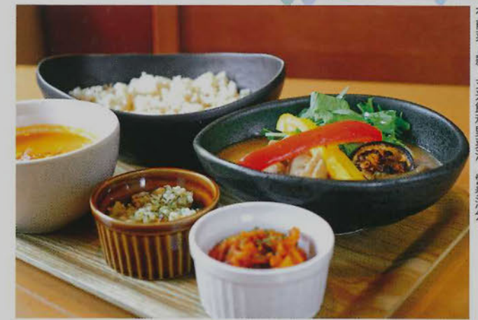
● Lunch set ¥1,250 (可自由挑選一款手作咖哩，另附有前菜2款、玄米飯和野菜湯，營養滿分。)

旅行時常常會不自覺吃太多和吃得健康。踏單車經過鴨川時，不妨到這間 musubi cafe 享用一頓健康午餐吧！小店是 hostel 和 cafe 二合一，主打自家製咖啡和野菜湯。為了提供最新鮮的料理給客人，所有食物都是落單後才開始製作。使用當地的時令食材和不加化學調味料及色素，是該店的兩大堅持。飲品和甜品方面，同樣從客人的健康出發，調配多