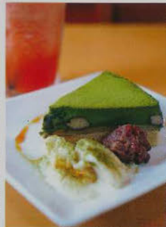
● 黑板牆上仔細介紹不同食材和做法。 ● 以京都著名菓子生八橋為藍本製作的抹茶蛋糕，沒有用上牛油、雞蛋和奶製品，十分健康。